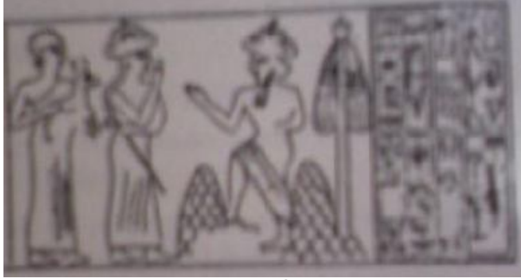
Tepeler Tanrısı ve Seçilmiş Adam