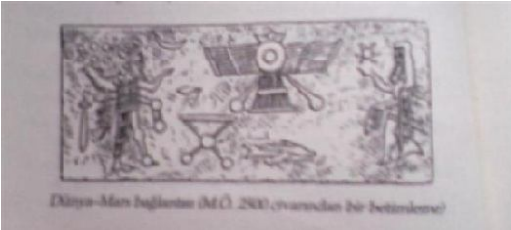
Dünya – Mars bağlantısı (M.Ö. 2500 civarından bir betimleme)

Ea ve Ebgal Dehşet Silahlarını gemiden çıkartıp saklarlar