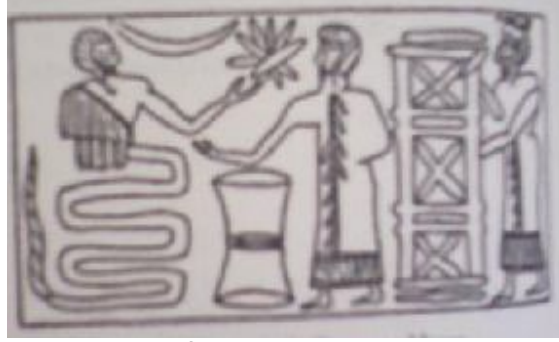
Enki Tufan ile ilgili sırrı açıklıyor

Geride kalan Anunnakiler Tufan Gününe hazırlanırlar Uyarı işaretini Aşağı Dünya'nın Efendisi Nergal verecektir