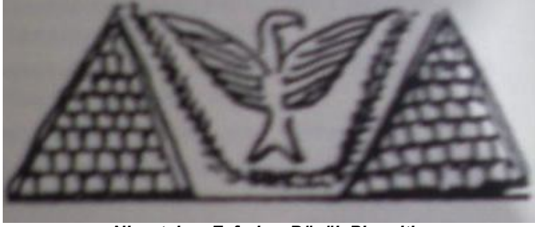
Ninurta'nın Zaferi ve Büyük Piramitler