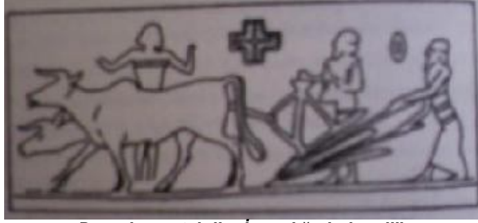
Davarlar ve tahıllar İnsanlığa bahşedilir