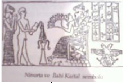
Ninurta ve İlahi Kartal sembolü

Marduk Abel'e çobanlığı ve yün eğirmeyi öğretir Su yüzünden dövüşürken Ka-in bir yumrukla Abel'i öldürür Ka-in cinayetle suçlanıp sürgüne yollanır Adapa ve Titi'nin başka çocukları olur ve aralarında evlenirler Adapa ölüm döşeğinde, varisi olarak oğlu Sati'yi kutsar Torunlarından biri olan Enkime, Marduk tarafından Lahmu'ya götürülür