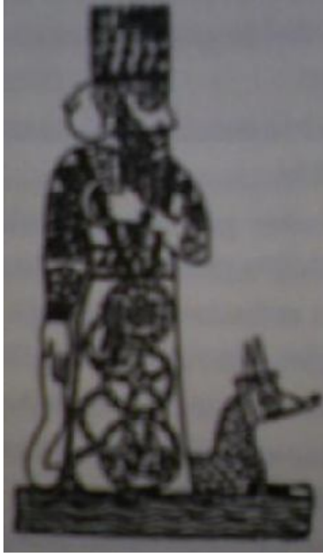
Şaşaalı Marduk'u gösteren bir Babil betimlemesi