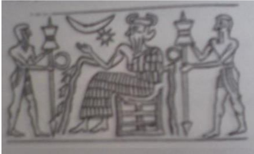
Suların ve madenlerin tanrısı olarak betimlenen Enki

Nibirulular azıcık altın tedarikine bile sevinirler Altının atmosfere kalkan olarak kullanımı sınırlı ve başarılı olur Dünya'ya daha çok kahraman ve yeni araç gereç yollar Sulardan altın çıkartma işlemi hayal kırıklığı yaratmayı sürdürür Ea, Abzu'da derinlerden kazılıp çıkartılması gereken altın kaynakları bulur Önemli bir karar için Enlil, sonra Anı Dünya'ya gelirler Üvey kardeşler kavga edince alacakları görevler kurayla belirlenir Enki (Dünya'nın Efendisi) unvanını alan Ea Abzu'ya gider Enlil, sabit tesisleri geliştirmek için Edin'de kalır Anu ayrılmaya hazırlanırken Alalu'nun saldırısına uğrar Yargılanan Yediler Alalu'yu Lahmu'ya sürgün cezasına çarptırırlar Anu'nun kızı Ninmah tıp subayı olarak Dünya'ya yollar Lahmu'da (Mars) uğrayan Ninmah, Alalu'yu ölmüş bulur Alalu'nun yüzünü andıracak biçimde oyulan bir kaya onun mezar taşı olur Anzu'ya Lahmu İstasyonunun komutası verilir