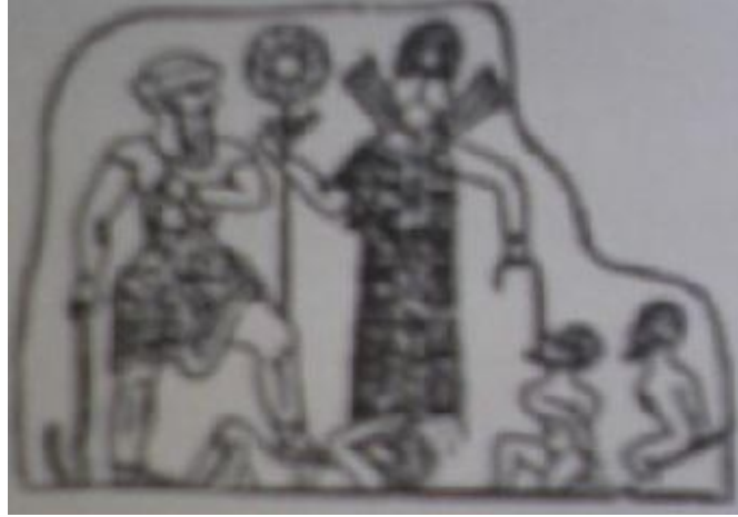
Tanrılar krallığı bahşeder, savaşlar başlar