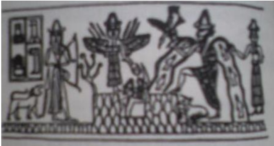
Enlil, Ninmah, Enki ve İsimud (Sümer betimlemesi)

Ninmah bir grup kadın hemşire ile Dünya'ya varır İksir sağlayan bitkiler yetiştirilmesi için tohumlar getirir Enlil'e, evlilik dışı beraberliklerinden doğan oğlu Ninurta'nın müjdesini verir Enki, Abzu'da bir mesken ve maden ocakları kurar Edin'De, Enlil uzay ve diğer tesisleri kurar Dünya'daki Nibiruluların ( ' Anunnakiler ' ) sayısı altı yüzü bulur Üç yüz ' İgigi ' Lahmu'daki (Mars) tesisleri işletir Sud'a zorla sahip olduğu için Enlil sürgüne gönderildiği sırada saklanan silahları öğrenir Sud, Enlil'in eşi Ninlil olur, ona bir oğul doğurur (Nannar) Ninmah Abzu'ya gidip Enki'ye katılır, ona kız çocuklar doğurur Enki'nin eşi Ninki, oğulları Marduk ile gelir Enki ve Enlil daha çok oğullar edindikçe Dünya'da kabileler oluşur Çektikleri güçlükler nedeniyle İgigiler, Enlil'e karşı bir darbe yapar Ninurta, onların önderi Anzu'yu hava savaşlarında yener Daha çok altın çıkartmaları izin zorlanan Anunnakiler isyan eder Enlil ve Ninurta isyancıları suçlarlar Enki yapay yolla İlkel İşçiler oluşturmayı önerir