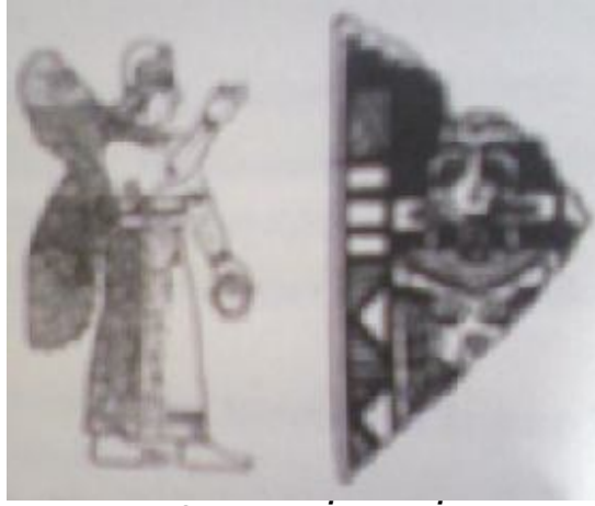
Utu (Şamaş) ve İnanna (İştâr)

Adapa ve Titi çiftleşir; iki oğulları olur: Ka-in ve Abael