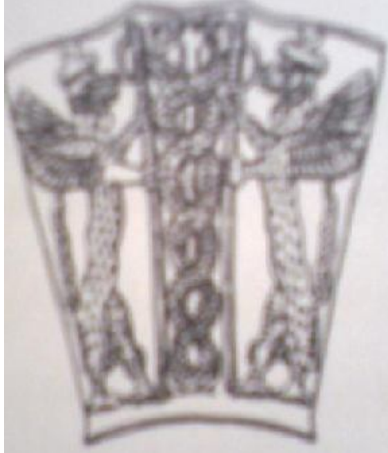
Ningişzidda'nın çift sarmalı DNA amblemi

Duyduklarına inanamayan önderlere Enki bir sır açıklar: Abzu'da, Anunnakileri andıran bir yaratık serbestçe dolaşmaktadır, Onun yaşam özü Anunnakilerin yaşam özüyle çoğaltılarak Zeki bir İkel işçi olması için niteliği artırılabilir. Enlil, Yaratmak Her Şeyi Başlatan Baba'ya mahsustur, diye bağırır Ninmah, Suretimizi zaten mevcut bir yaratığa vereceğiz, diye savunur Hayatta kalabilmek için altına fena halde ihtiyacı olan önderler 'evet' derler Enki, Ninmah ve Enki'nin oğlu Ningişzidda deneylere başlarlar Pek çok başarısızlıktan sonra kusursuz model Adamu elde edilir Bubaşarisından dolayı Ninti ( 'Yaşam Hanımı' ) unvanını alır Enki'nin eşi Ninki dişi Dünyalının, Ti-Amat'ın biçimlendirilmesine yardım eder Melez olan Dünyalılar çiftleşmekte ama üreyememektedirler Ningişzidda onların Yaşam Ağacına iki önemli dal daha ekler Onaylanmamış işler yapıldığını keşfeden Enlil, Dünyalıları kovar